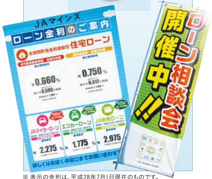
※表示の金利は、平成28年7月1日現在のものです。