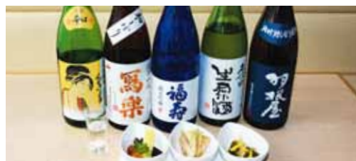
素材をいかした料理は日本酒に合います