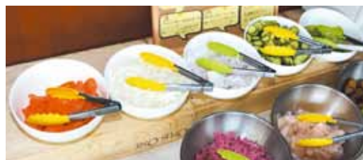
調布野菜がたっぷり。ランチのサラダバー